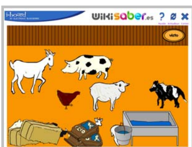
CRÍAS DE ANIMALES

Conjunto de recursos para alumnos y alumnas del segundo ciclo de Educación Infantil. Se dirigen a la adquisición de distintos objetivos con un acercamiento global a todos los ámbitos de desarrollo establecidos en esta etapa. El grupo está compuesto por las siguientes actividades: