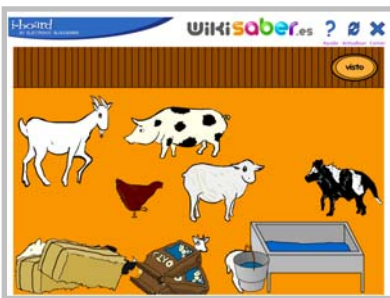
CRÍAS DE ANIMALES

Conjunto de recursos para alumnos y alumnas del segundo ciclo de Educación Infantil. Se dirigen a la adquisición de distintos objetivos con un acercamiento global a todos los ámbitos de desarrollo establecidos en esta etapa. El grupo está compuesto por las siguientes actividades: