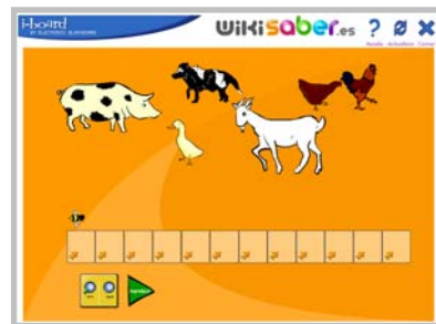
SONIDOS DE ANIMALES